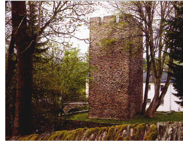
Der Paßklausenturm in Tannen-berg aus dem 12. Jahrhundert