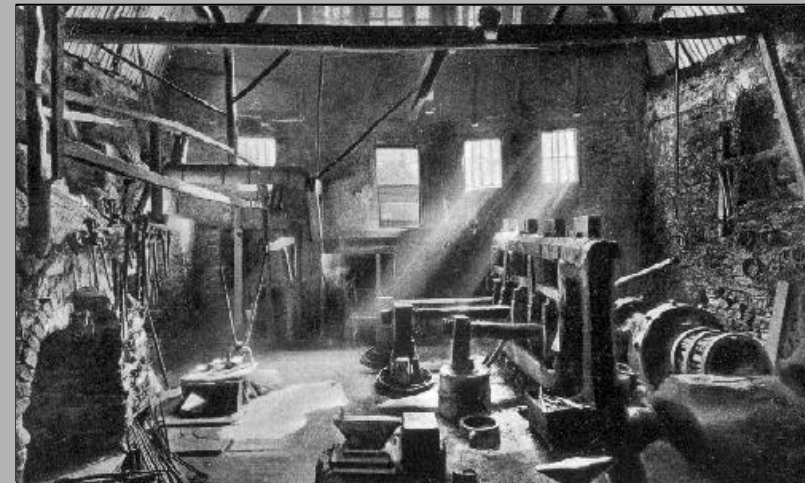
Der Frohnauer Hammer zeigt traditionelle Hammerwerkstechnik aus dem 17. Jh.

Zum Ende des 19. Jahrhunderts wurde die Arbeit jedoch zunehmend unproduktiver, so daß der regelmäßige Betrieb 1895 eingestellt und das